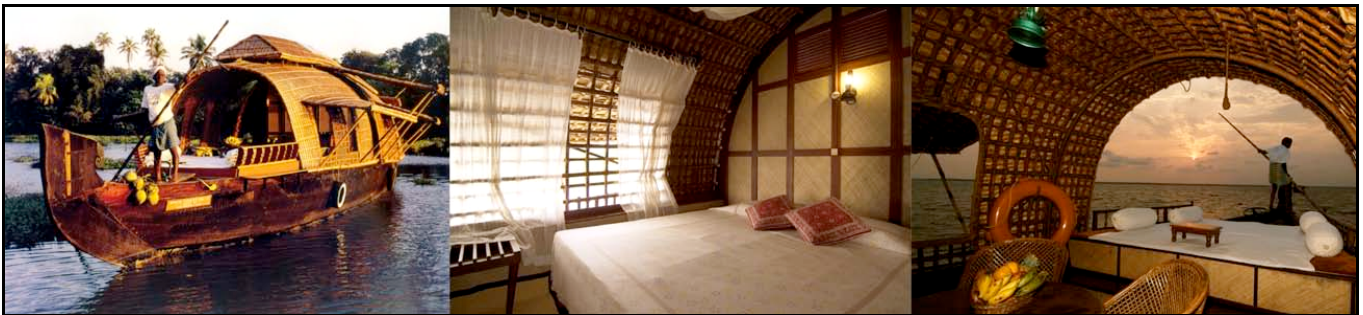
Houseboat – localmente chiamata "kettuvallam"

Pernottamento sulla Deluxe Houseboat (BLD)