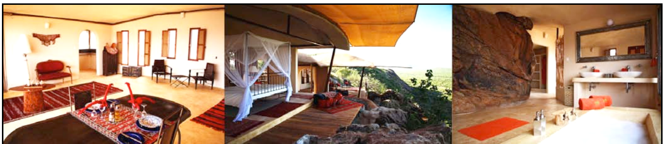
Saruni Samburu Safari Lodge

Pernottamento al Saruni Samburu. (B L D)