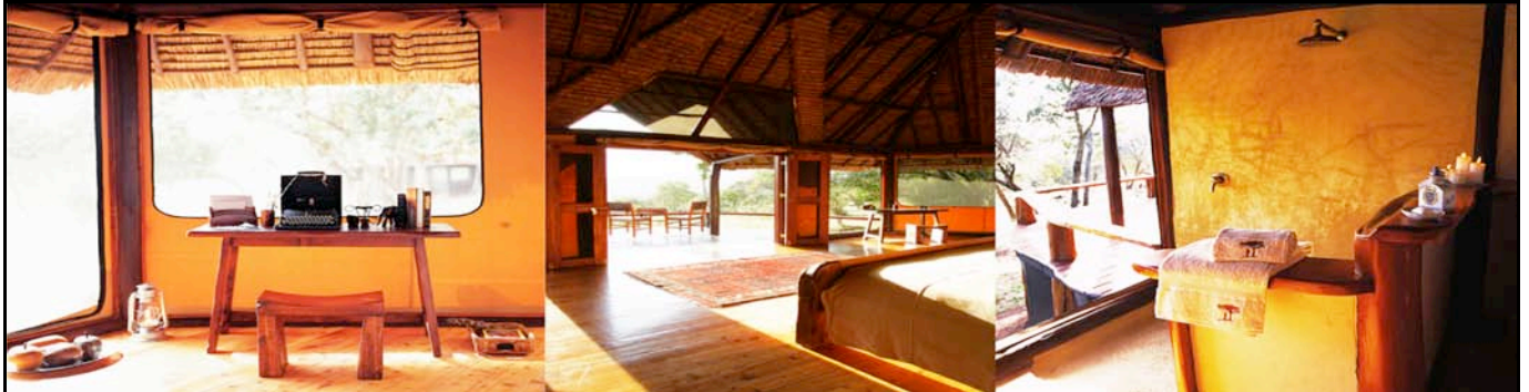
Saruni Mara Safari Lodge

Pernottamento al Saruni Mara Safari Lodge. (BLD)