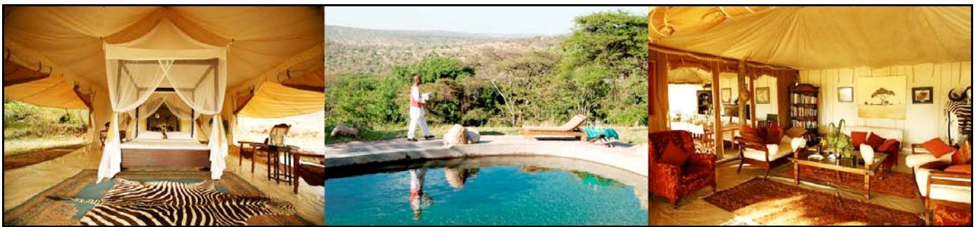
Cottars 1920's Safari Camp

Pernottamento al Cottars 1920's Safari Camp. (BLD)