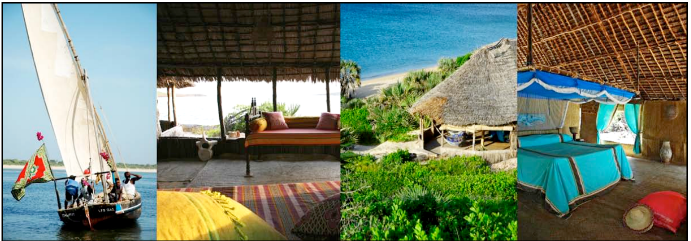
Kiwayu Safari Village

Pernottamento al Kiwayu Safari Village. (BLD)