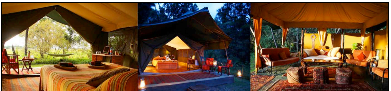
Elephant Pepper Camp

Pernottamento all'Elephant Pepper Camp. (BLD)