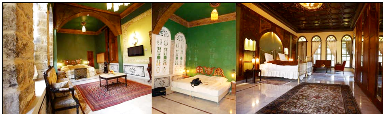
Dar Al Noor Boutique Hotel

Pernottamento al Dar Al Noor Boutique Hotel. (HB)