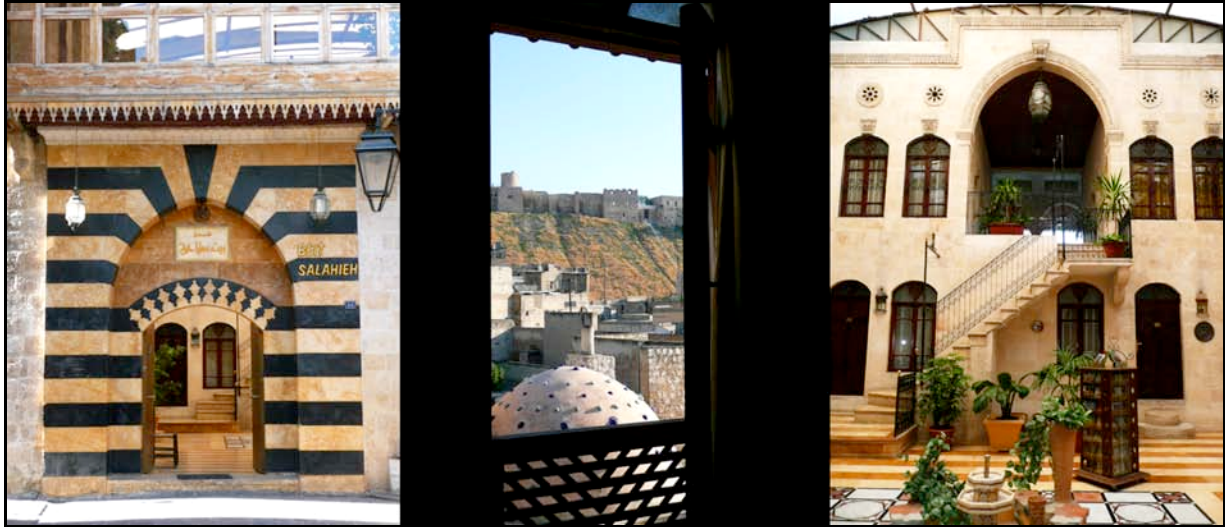
Beit Salahieh Hotel

Cena e pernottamento al Beit Salahieh Hotel. (HB)