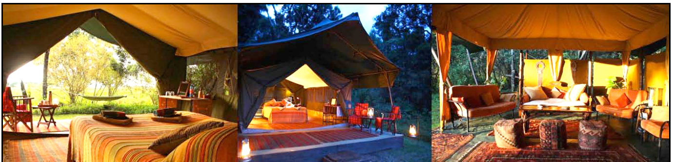
Elephant Pepper Camp

Pernottamento all'Elephant Pepper Camp. (BLD)