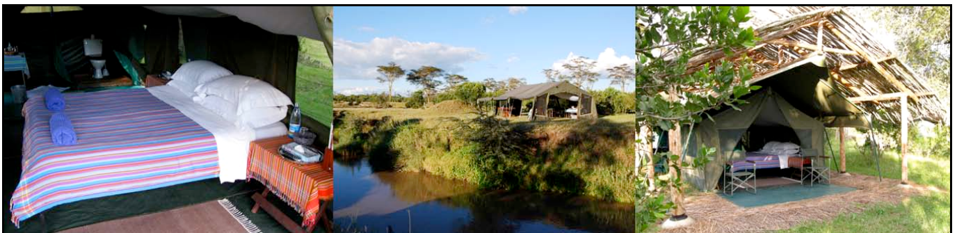
Ol Pejeta Bush Camp

Pernottamento all'Ol Pejeta Bush Camp. (B L D)